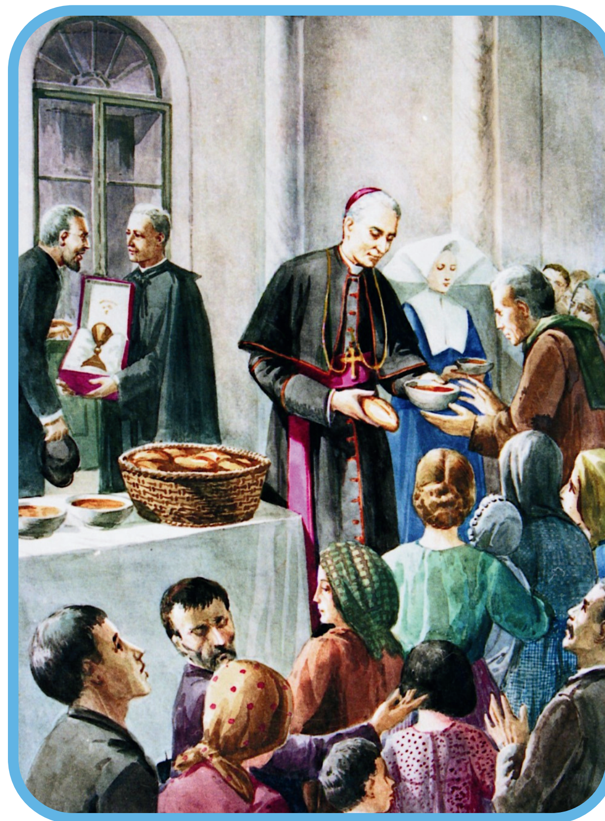
San Scalabrini distribuyendo comida y ropa a los necesitados.