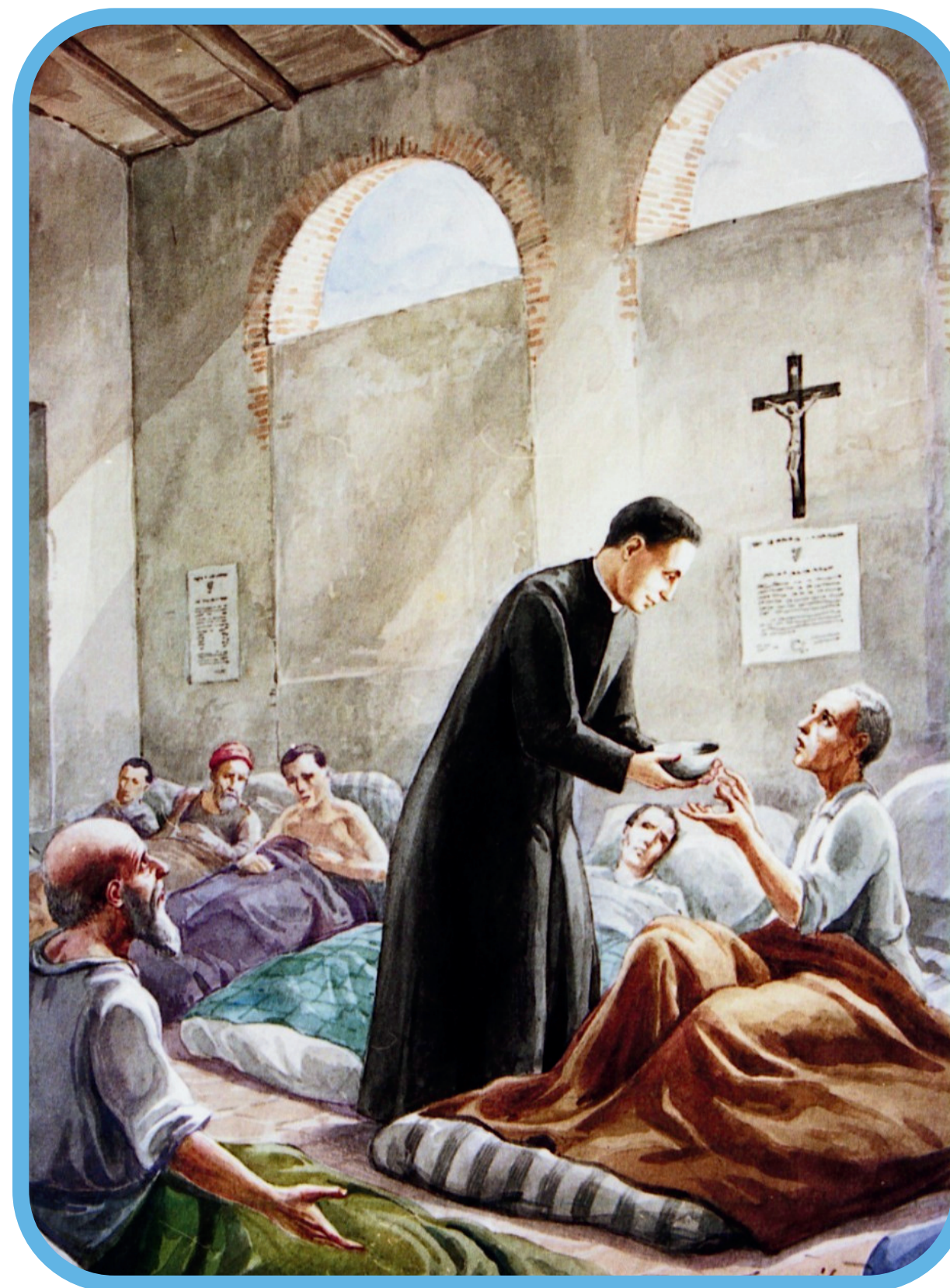
1867, San Scalabrini ayuda a los afectados por la epidemia de cólera que asoló la región de Como, Italia.