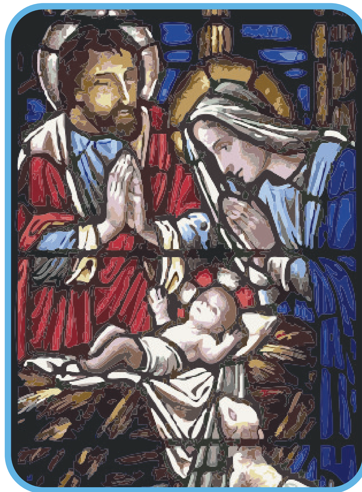
La Sagrada Familia, primer y más perfecto ejemplo de amor, apoyo y cuidado mutuo.